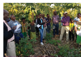
© Banco Canadiense de Agricultura Alimentaria